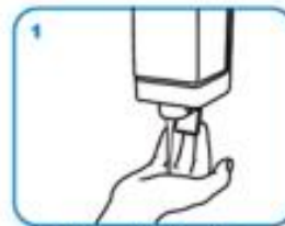
Nanesite dovoljnu količinu sapuna