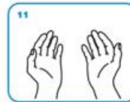
Ruke osušiti ubrusom koji se može iskoristiti za zatvaranje slavine.