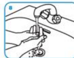
Palčevi kao i vrhovi prstiju su posebno bitni. Nakon temeljnog trljanja – ruke je potrebno isprati pod mlazom vode.